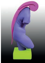
6 Carmen Otero Avatar, 2016 Figura de escayola del torso de Venus intervenida con óleo y madera 15 x 20 x 42.5 cm