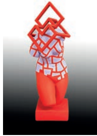
5 Carlos Evangelista Elegía, 2016 Figura de escayola del torso de Venus intervenida con óleo y madera 16 x 19 x 48 cm