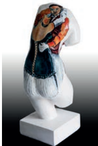
14 María Jesús De Frutos Mujer, 2016 Figura de escayola del torso de Venus intervenida con óleo 14 x 15.5 x 38 cm