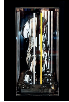
19 Pedro Sandoval Dama en espacio íntimo I (Soto como pretexto), 2016 Figura de escayola del torso de Venus con metacrilato, intervenidos con óleo y resina 22.5 x 22.5 x 50 cm