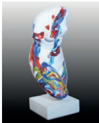
3 Belinda Washington See your fire, 2016 Figura de escayola del torso de Venus intervenida con acrílico 14 x 15.5 x 38 cm