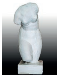
15 Mayte Spínola Caricias, 2016 Figura de escayola del torso de Venus intervenida con óleo 14 x 15.5 x 38 cm

• Todas las obras serán subastadas con precio base € 1.000