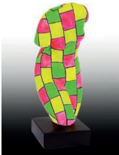
2 Bárbara Cano De La Plaza Venus RX.2, 2016 Figura de escayola del torso de Venus intervenida con acrílico 14 x 15.5 x 38 cm