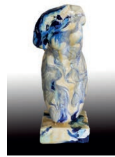
9 Gabriel Moreno Blue Velvet. Homenaje Isabella Rossellini, 2016 Figura de escayola del torso de Venus intervenida con acrílico y resina 14 x 15.5 x 38 cm