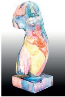
1 Aracely Alarcón Entre velos, 2016 Figura de escayola del torso de Venus intervenida con acuarela 14 x 15.5 x 38 cm