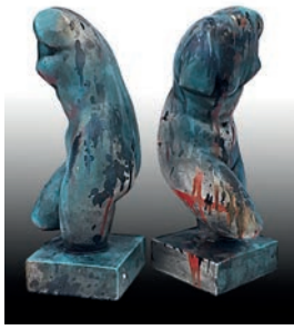
12 Lita Cabellut Empatía, 2016 Figura de escayola del torso de Venus intervenida con acrílico proyectado con aerógrafo 14 x 15.5 x 38 cm