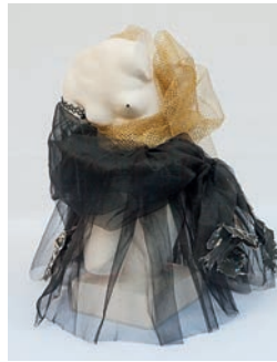
17 Rosa Gallego del Peso Tu mirada me hizo Venus, 2016 Figura de escayola del torso de Venus intervenida con tul negro y dorado 22.5 x 22.5 x 41 cm