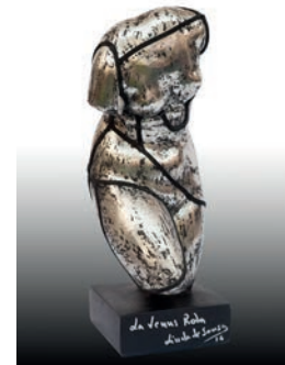
11 Linda De Sousa La venus rota, 2016 Figura de escayola del torso de Venus intervenida con óleo, pintura metálica y cinta 14 x 15.5 x 38 cm