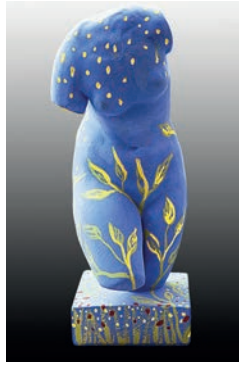
16 Ouka Lelee De luna y sol sus formas, de viento y lluvia sus aromas y de nuestras almas sus colores, 2016 Figura de escayola del torso de Venus intervenida con gouache 14 x 15.5 x 38 cm