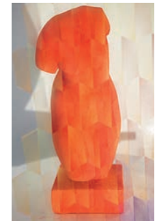
10 Juan Gerstl La mujer de fuego, 2016 Figura de escayola del torso de Venus intervenida con pigmentos y metacrilato 15.5 x 17 x 43 cm