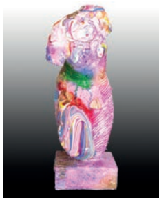
4 Blanca Cuesta Frida, 2016 Figura de escayola del torso de Venus intervenida con óleo 14 x 15.5 x 38 cm