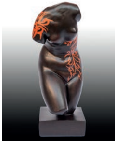
13 Manuela Picó Tattoo, 2016 Figura de escayola del torso de Venus intervenida con acrílico 14 x 15.5 x 38 cm