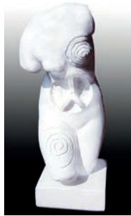
18 Rosana Sin miedo, 2016 Figura de escayola del torso de Venus intervenida con óleo 14 x 15.5 x 38 cm