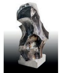
8 Diego Canogar La Venus de las esferas ausentes, 2016 Figura de escayola del torso de Venus intervenida con acero inoxidable 19 x 19 x 38 cm