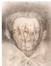
104 Álvaro Gómez Vuelvan caras , 1982 Pastel y lápices de colores s/papel, 82 x 63 cm Firmado abajo izquierda Precio Base: Bs. 600.000