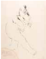
122 Carlos Poveda S/t, S/f Tinta s/papel, 73 x 55 cm Firmado abajo derecha Precio Base: Bs. 600.000