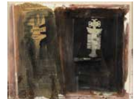
78 Matheus S/t, 1986 Mixta s/papel, 28 x 22 cm Firmado abajo derecha Precio Base: Bs. 600.000