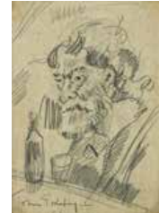
36 Tomás Golding Retrato de Reverón, 1961 Grafito s/papel, 31.5 x 21.5 cm Firmado abajo izquierda Precio Base: Bs. 800.000