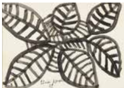
24 Elsa Morales S/t, 2003 Tinta s/papel, 18 x 25 cm Firmado abajo centro Precio Base: Bs. 600.000