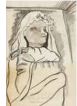
16 Jacobo Borges Estudio para la comunión, 1981 Tinta china s/papel, 46 x 30.5 cm Firmado abajo centro Precio Base: Bs. 5.000.000