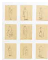
35 Héctor Poleo S/t, 1940 Carboncillo s/papel, 13.5 x 10 cm Sin firma Precio Base: Bs. 6.000.000