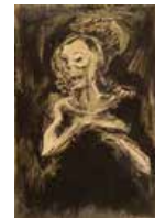
74 Mateo Manaure Hambre, S/f Dibujo s/papel, 17 x 14 cm Firmado dorso Precio Base: Bs. 1.000.000