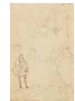
19 Arturo Michelena S/t, S/f Tinta s/papel, 34 x 22 cm Sin firma Precio Base: Bs. 5.000.000