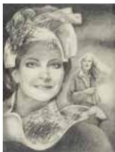
89 Luis Domínguez Salazar S/t, 1985 Grafito s/papel, 29 x 22 cm Firmado abajo derecha Precio Base: Bs. 800.000