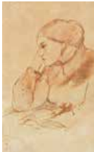
127 Emilio Boggio S/t, S/f Tinta s/papel, 19.5 x 12 cm Sin firma Precio Base: Bs. 1.500.000