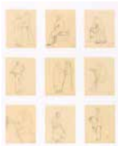
82 Héctor Poleo S/t, 1940 Carboncillo s/papel, 13.5 x 10 cm Sin firma Precio Base: Bs. 6.000.000