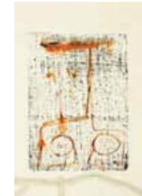
79 Guzmán S/t, 1976 Mixta s/papel, 54 x 36 cm Firmado arriba izquierda Precio Base: Bs. 600.000