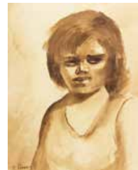
54 Trino Orozco Negra en chimo, 1968 Acuarela s/papel, 59 x 47 cm Firmado abajo izquierda Precio Base: Bs. 600.000