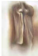
108 Roberto Estopiñán S/t, S/f Pastel y grafito s/papel Stonehenge, 112 x 76 cm Firmado abajo derecha Precio Base: Bs. 600.000