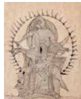
69 Mario Abreu S/t, S/f Tinta/papel, 34 x 34 cm Firmado abajo izquierda Precio Base: Bs. 1.000.000