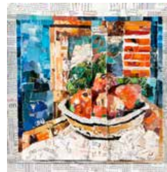
112 Jorge Salas Paisaje interior con bodegón , 2011 Vaciado/resina y papel, 37 x 36 x 7 cm Firmado abajo derecha Precio Base: Bs. 600.000