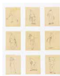
134 Héctor Poleo S/t, 1940 Carboncillo s/papel, 13.5 x 10 cm Sin firma Precio Base: Bs. 6.000.000