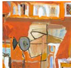
49 Manuel Quintana Castillo Collage Femenina, 1978 Collage s/papel, 15 x 15 cm Firmado abajo derecha Precio Base: Bs. 600.000