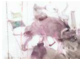
75 Anibal Ortizpozo Carnaval electoral o El tigre de papel, 1988 Acuarela s/papel, 37 x 47 cm Firmado certificado Precio Base: Bs. 600.000