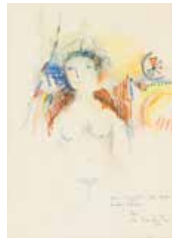
68 Hugo Baptista S/t, 1977 Mixta s/papel, 28 x 21 cm Firmado abajo derecha Precio Base: Bs. 600.000