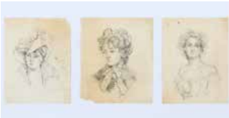
2 Emilio Boggio S/t, S/f Lápiz s/papel, 27.5 x 72.5 cm Sin firma Precio Base: Bs. 1.500.000