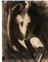
107 Mateo Manaure S/t, S/f Carboncillo s/papel, 24.5 x 18 cm Sin firma Precio Base: Bs. 2.500.000