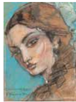
106 Pascual Navarro S/t, 1973 Pastel s/papel, 33 x 29 cm Firmado abajo derecha Precio Base: Bs. 1.000.000