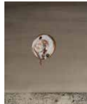
113 Marietta Berman S/t, 1975 Mixta s/papel, 47 x 35 cm Firmado abajo derecha Precio Base: Bs. 600.000