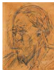
110 Tomás Golding S/t, 1955 Dibujo s/papel, 33 x 27 cm Firmado abajo derecha Precio Base: Bs. 800.000