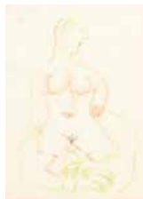
132 Pedro León Zapata S/t, 1988 Creyón s/papel, 38 x 28 cm Firmado arriba izquierda Precio Base: Bs. 1.500.000