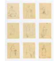
77 Héctor Poleo S/t, 1940 Carboncillo s/papel, 13.5 x 10 cm Sin firma Precio Base: Bs. 6.000.000