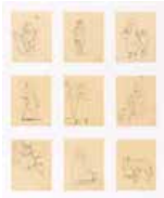
121 Héctor Poleo S/t, 1940 Carboncillo s/papel, 13.5 x 10 cm Sin firma Precio Base: Bs. 6.000.000