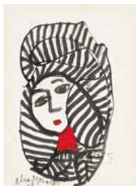
25 Elsa Morales S/t, 2003 Tinta s/papel, 25 x 18 cm Firmado abajo izquierda Precio Base: Bs. 600.000