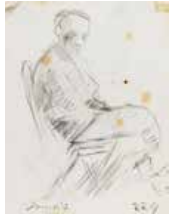
101 Rafael Ramón González S/t, S/f Lápiz s/papel, 14 x 12.5 cm Firmado abajo derecha Precio Base: Bs. 600.000