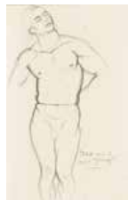
88 Pedro Centeno Vallenilla Estudio para el Cacique Yaracuy, S/f Tinta s/papel, 28.5 x 18.5 cm Sin firma Precio Base: Bs. 600.000