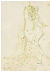
63 Mario Abreu S/t, S/f Tinta s/papel, 29.5 x 20 cm Firmado abajo izquierda Precio Base: Bs. 1.000.000