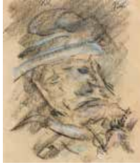
41 Pascual Navarro S/t, S/f Pastel s/papel, 19 x 16 cm Firmado abajo derecha Precio Base: Bs. 600.000