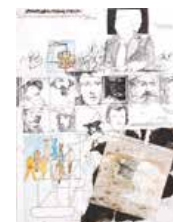
139 Juan Pedro Posani Retrato de autor intelectual, 1979 Mixta s/papel, 53.5 x 51.5 cm Firmado abajo izquierda Precio Base: Bs. 800.000