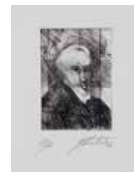
114 Antonio Lazo S/t, 1976 Carboncillo s/papel, 11.5 x 9.5 cm Firmado abajo derecha Precio Base: Bs. 600.000