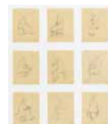
80 Héctor Poleo S/t, 1940 Carboncillo s/papel, 13.5 x 10 cm Firmado abajo centro Precio Base: Bs. 6.000.000