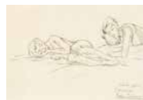
94 Pedro Centeno Vallenilla Estudio para Cibernética, S/f Grafito s/papel, 22 x 31 cm Firmado abajo derecha Precio Base: Bs. 1.000.000