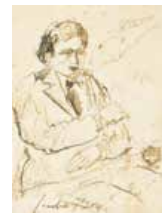
8 Jacobo Borges S/t, 1966 Mixta s/papel, 17 x 12 cm Firmado abajo izquierda Precio Base: Bs. 600.000