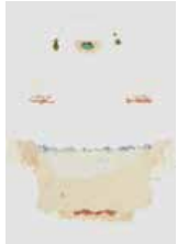
42 Ricardo Benaím S/t, 1984 Mixta s/papel, 49 x 34.5 cm Firmado abajo derecha Precio Base: Bs. 600.000