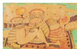
135 Elbano Méndez Osuna S/t, 1968 Mixta s/cartulina, 47 x 64 cm Firmado abajo izquierda Precio Base: Bs. 600.000