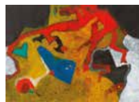
109 Francisco Monsanto S/t, S/f Dibujo s/papel, 52 x 72 cm Firmado abajo derecha Precio Base: Bs. 800.000