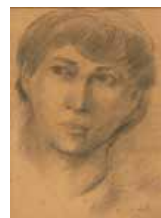
133 Gabriel Bracho Cabeza, 1970 Grafito s/papel, 34 x 24 cm Firmado abajo derecha Precio Base: Bs. 800.000