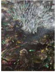
81 Alberto Brandt S/t, 1960 Acuarela s/papel, 27 x 20 cm Firmado arriba izquierda Precio Base: Bs. 600.000