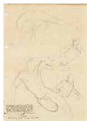
130 Pedro Centeno Vallenilla Figuras, S/f Grafito s/papel, 28 x 20 cm Sin firma Precio Base: Bs. 1.000.000