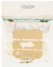
43 Ricardo Benaím S/t, S/f Mixta s/papel, 50 x 33.5 cm Firmado abajo derecha Precio Base: Bs. 600.000