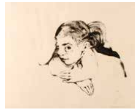
111 Carlos Poveda S/t, 1965 Tinta s/papel, 41 x 51 cm Firmado abajo derecha Precio Base: Bs. 600.000