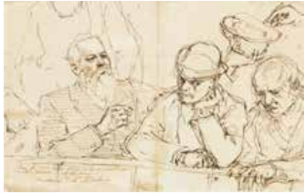
1 Arturo Michelena S/t, S/f Tinta s/papel, 15.5 x 24.5 cm Sin firma Precio Base: Bs. 6.000.000