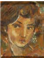
123 Pascual Navarro S/t, 1995 Acuarela s/papel y cartón piedra, 12 x 9.5 cm Firmado abajo izquierda Precio Base: Bs. 600.000