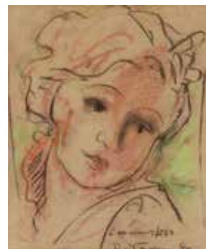
50 Pascual Navarro Rostro de Mujer, 1976 Pastel sobre Papel, 25cm X 20cm Firmado abajo derecha Precio Base: Bs. 600.000