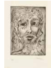
17 Swen S/t, S/f Tinta s/papel, 17.5 x 13 cm Firmado abajo derecha Precio Base: Bs. 600.000