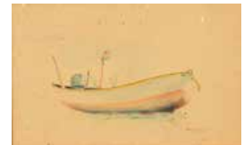
117 León Carrillo Marina , 1972 Acuarela s/papel, 18 x 30 cm Firmado abajo derecha Precio Base: Bs. 600.000