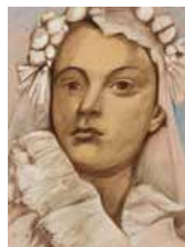
14 Luis Guevara Moreno S/t, 1984 Creyón s/papel, 72.5 x 56 cm Firmado abajo izquierda Precio Base: Bs. 600.000