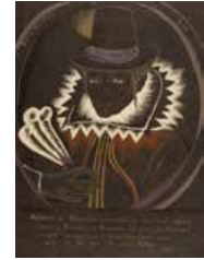
76 Marisol Escobar P. Poco hontas, 1976 Litografía s/papel, 82 x 66 cm Firmado abajo derecha Precio Base: Bs. 6.000.000