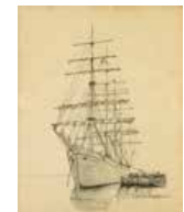
18 William Morris S/t, 1977 Lápiz s/papel, 24 x 19 cm Firmado abajo derecha Precio Base: Bs. 1.000.000