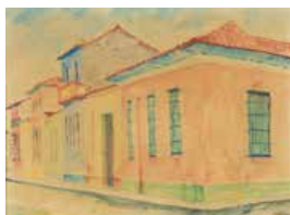
128 Leopoldo La Madriz S/t, S/f Acuarela s/papel, 24 x 31 cm Firmado abajo derecha Precio Base: Bs. 800.000