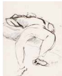
70 Emiro Lobo S/t, 1967 Tinta s/cartulina, 28 x 22.5 cm Firmado abajo derecha Precio Base: Bs. 600.000