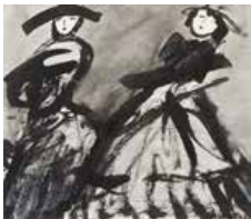
23 Azalea Quiñones S/t, 1985 Acuarela s/papel, 24 x 28 cm Firmado abajo derecha Precio Base: Bs. 600.000