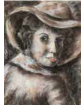
11 Pascual Navarro S/t, S/f Pastel s/papel, 26 x 20 cm Firmado centro derecha Precio Base: Bs. 600.000