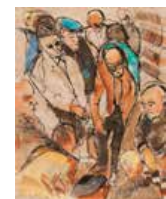
138 Guillermo Márquez Figuras, 1966 Gouache s/papel, 34.5 x 27.5 cm Firmado abajo izquierda Precio Base: Bs. 800.000