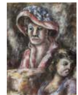
137 Pascual Navarro S/t, S/f Pastel s/papel, 27 x 20 cm Firmado arriba centro Precio Base: Bs. 600.000