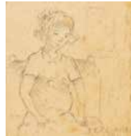
27 Rafael Ramón González S/t, 1960 Lápiz s/papel, 10.5 x 9.5 cm Firmado abajo derecha Precio Base: Bs. 800.000