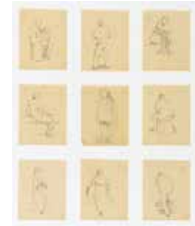
136 Héctor Poleo S/t, 1940 Carboncillo s/papel, 13.5 x 10 cm Firmado abajo centro Precio Base: Bs. 6.000.000