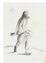
9 César Rengifo S/t, 1978 Lápiz s/papel, 29 x 21 cm Firmado abajo derecha Precio Base: Bs. 600.000