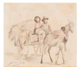
100 Luis Guevara Moreno S/t, 1983 Carboncillo s/papel, 20.5 x 24 cm Firmado abajo izquierda Precio Base: Bs. 600.000