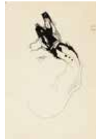
67 Miguel Von Dangel S/t, 1978 Tinta s/papel, 30 x 20 cm Firmado centro Precio Base: Bs. 600.000