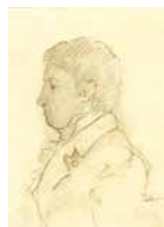
103 Héctor Poleo S/t, S/f Lápiz s/papel, 17.5 x 12 cm Firmado abajo derecha Precio Base: Bs. 1.000.000