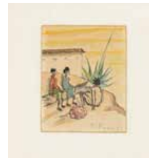
73 César Rengifo S/t, S/f Acuarela s/papel, 16 x 12 cm Firmado abajo derecha Precio Base: Bs. 1.000.000