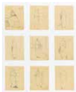
84 Héctor Poleo S/t, S/f Carboncillo s/papel, 13.5 x 10 cm Firmado abajo centro Precio Base: Bs. 6.000.000