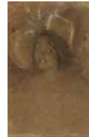
12 Emilio Boggio S/t, S/f Pastel s/papel, 22.5 x 14 cm Sin firma Precio Base: Bs. 1.000.000