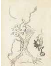
62 Mario Abreu S/t, 1957 Lápiz s/papel, 26 x 20 cm Firmado abajo centro Precio Base: Bs. 1.000.000